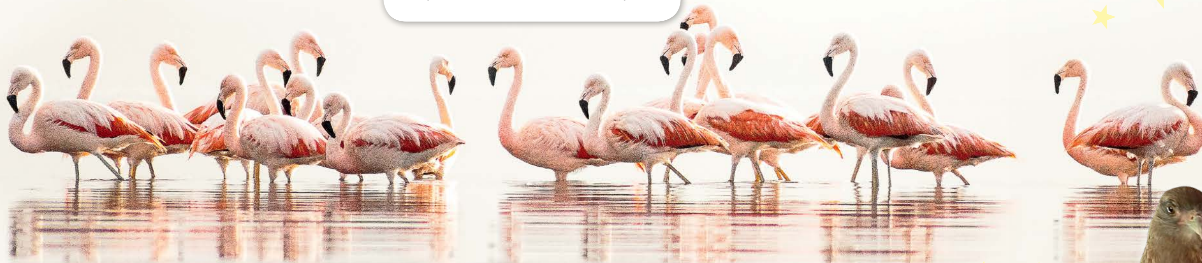
Flamencos australes ( Phoenicopterus chilensis ), imagen de Cuyén Slama, de 16 años, que vive en Agua de oro, provincia de Córdoba.

“Mi pasión por las aves nació gracias a mi mamá Cecilia, que me llevaba a sus salidas de observación desde los 5 o 6 años. Me encantan los halconcitos colorados , porque son muy lindos y versátiles, y los tucúqueres , desde que rehabilitamos a tres de ellos y los liberamos. Conocí a mucha gente a través de Pajareritos. Me encanta socializar y el grupo me ayudó a sobrellevar la cuarentena con actividades divertidas por whatsapp y, cuando se pudo, al aire libre”.